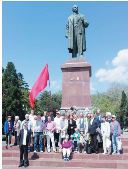
22 апреля ялтинцы отметили 148-ю годовщину со дня рождения В.И. Ленина.