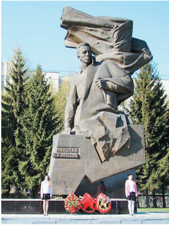
Памятник Н.И. Кузнецову в Екатеринбурге

По одной из версий, именно грамотное поведение в критических ситуациях, а также безупречное знание коми-пермяцкого языка привлекло к нему внимание органов госбезопасности, которые задействовали Кузнецова в акциях ОГПУ округа для ликвидации бандитских лесных формирований. С весны 1938 года Николай Иванович